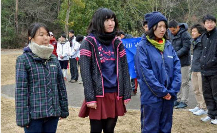
ウェスタンカップ WA 優勝の星さんから