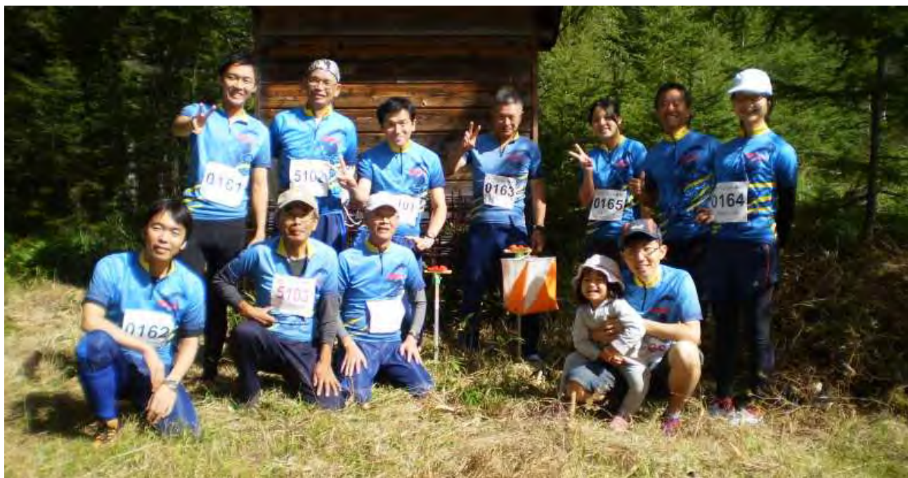
AチームとVチームの11人 そして未来の女子エリート