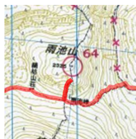
64番まで行っていない