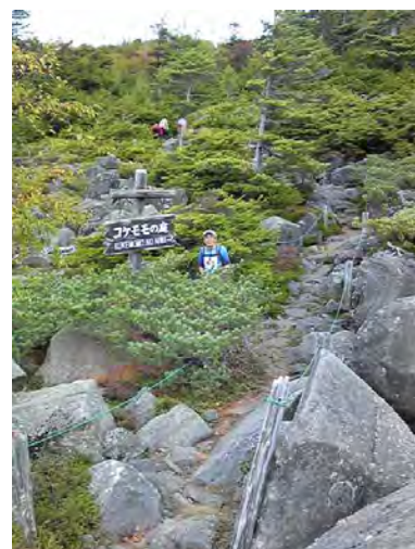
ロゲイニング62番の通過証明写真